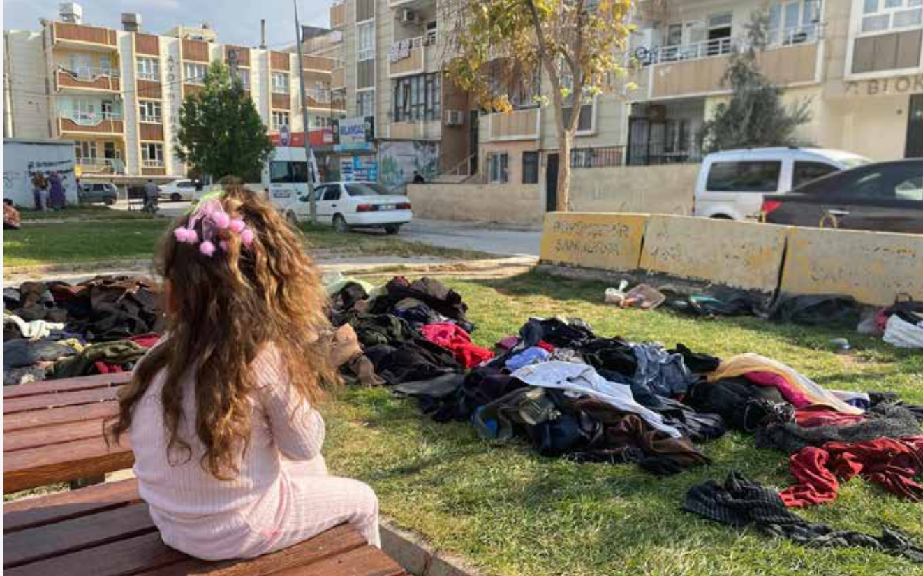
Babam elin eskilerini giyerdi. Ben bu yüzden ezik olurum bayram sabahlarında...