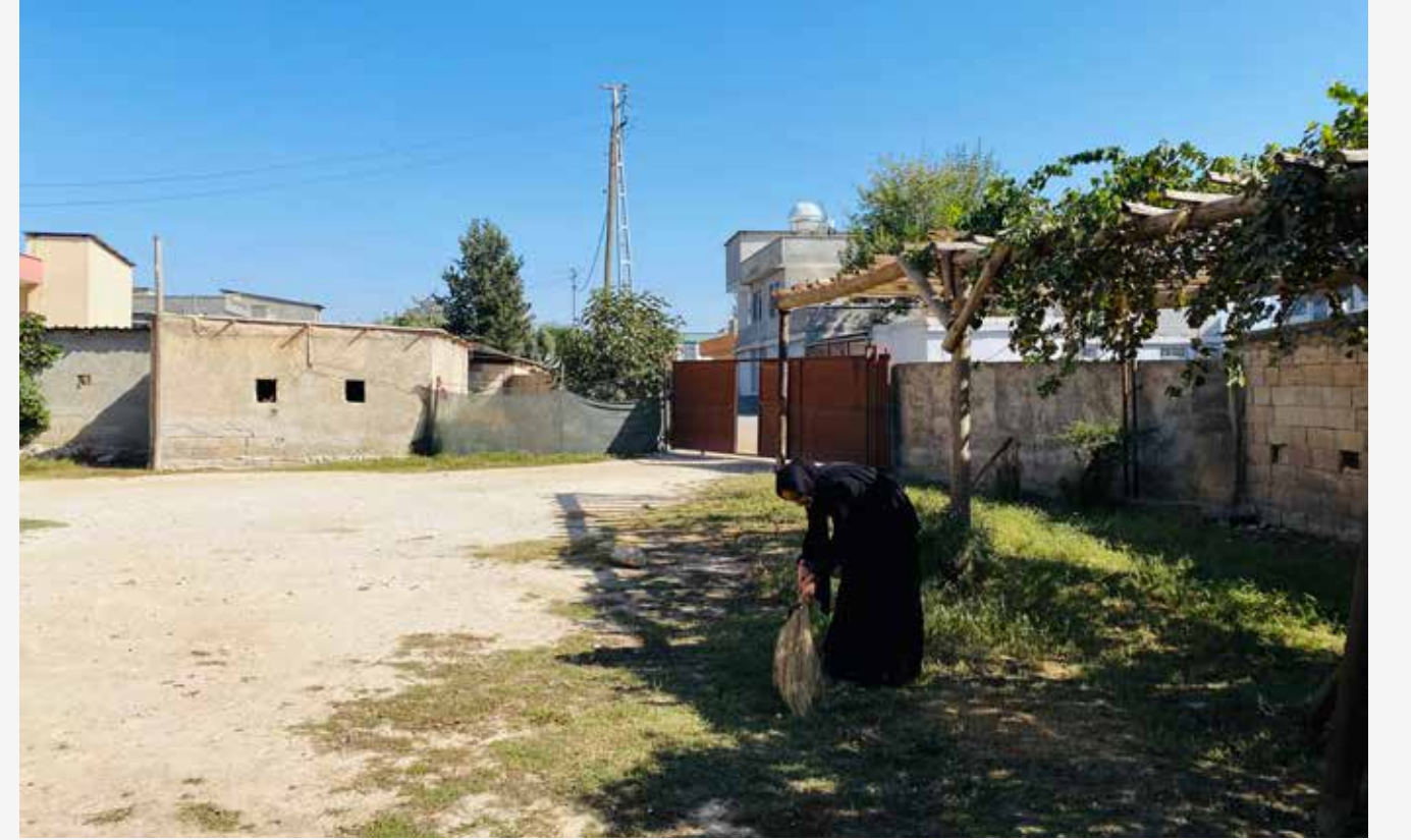
Bahçeyi süpürmeyi seviyorum çünkü toprak kokusunu çok seviyorum.