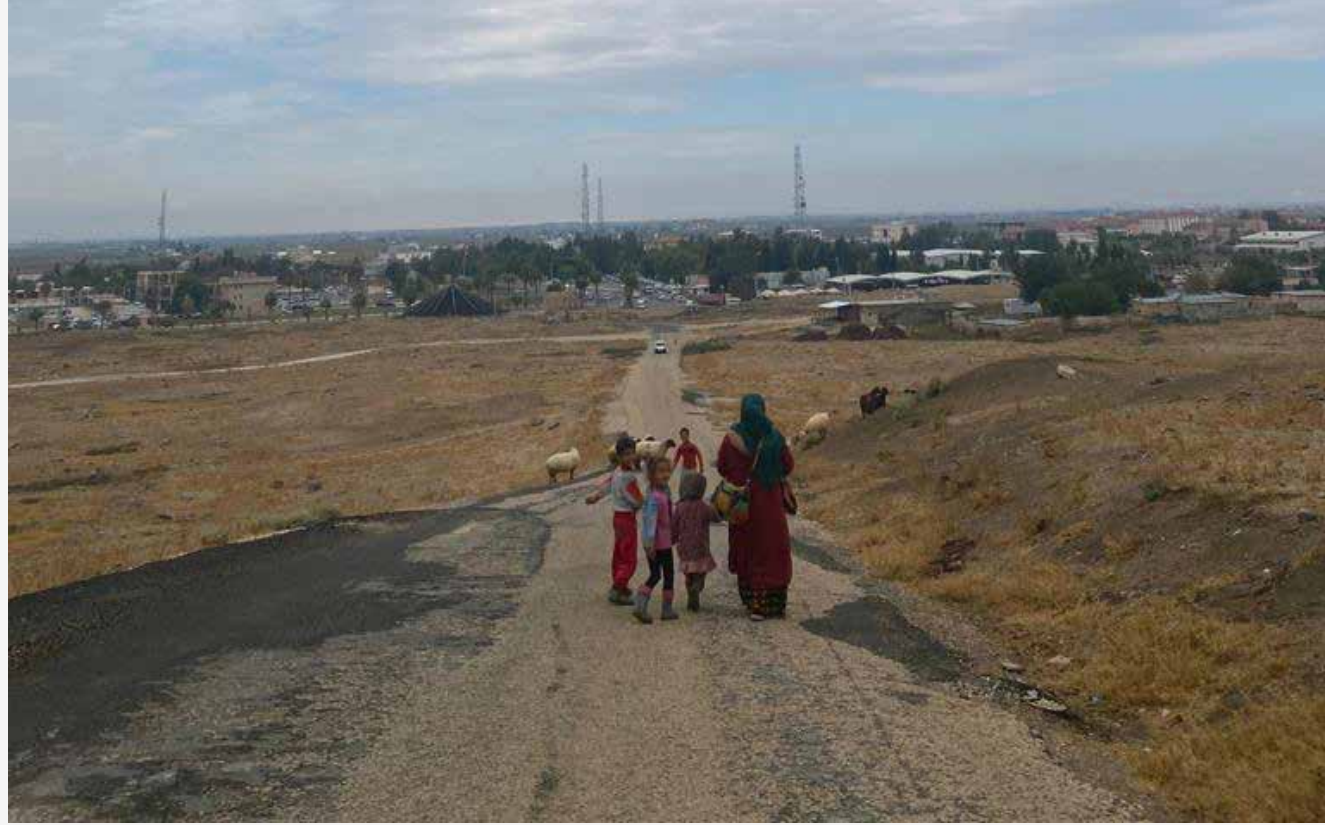
Yol bazen çok ağır gelir...