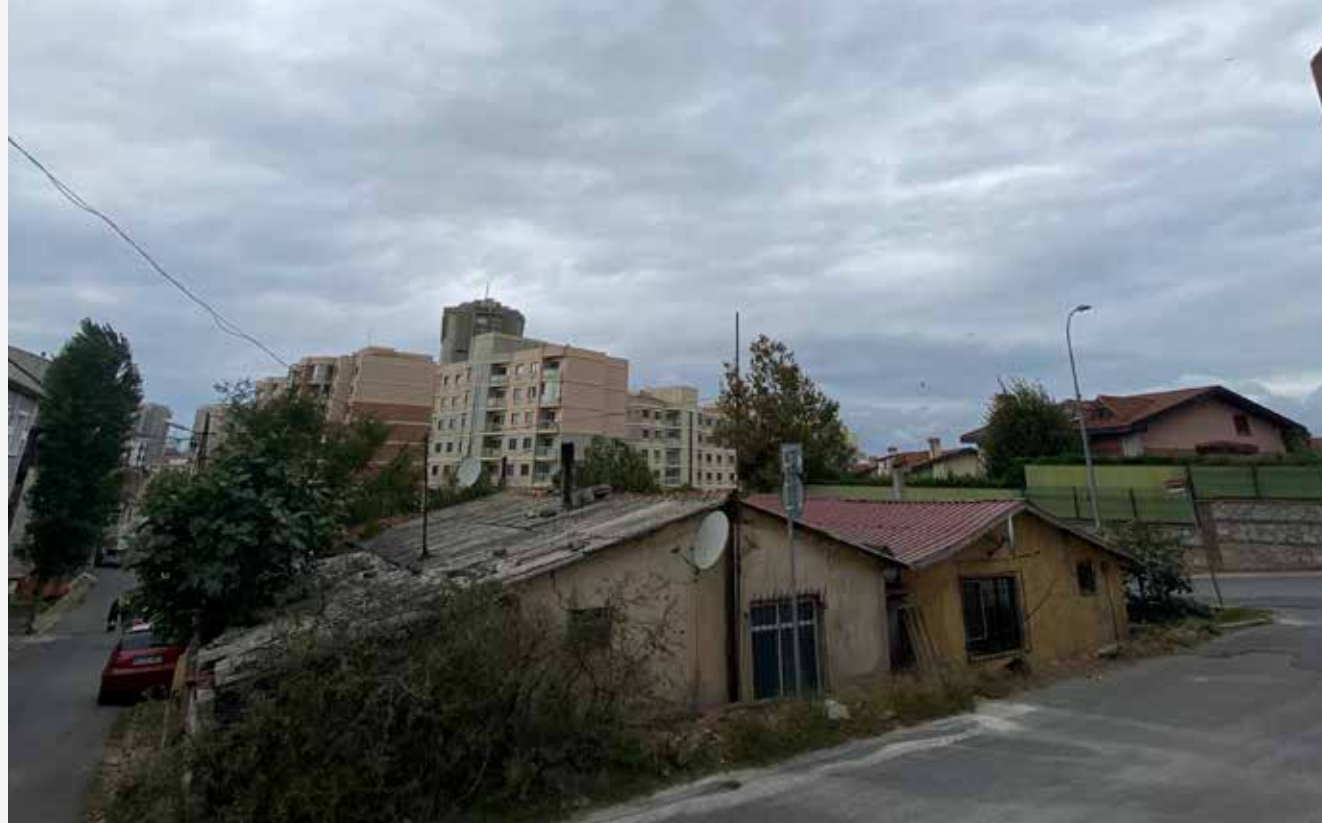
Defne, 15 yaşında İstanbul

Mahalledeki çarpık kentleşme sorununa değinmek istedim. Ben güvenli modern bir sitenin içinde yaşarken, hemen yanı başımdaki mahallede çarpık kentleşme, gecekondular ve sanayi ortamı var; içinde tehlikeler ve imkânsızlıklar barındırıyor.