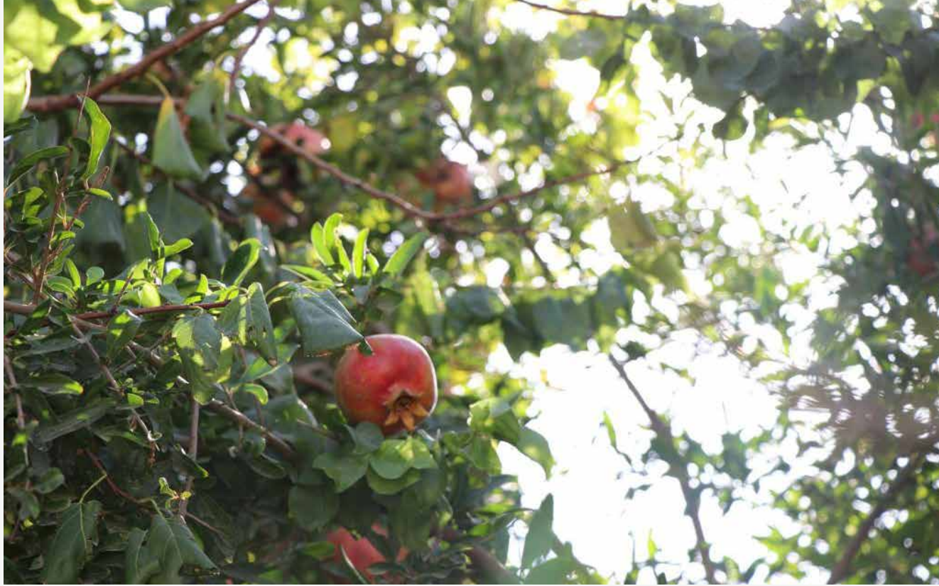
İçi dolu dolu boncuk.