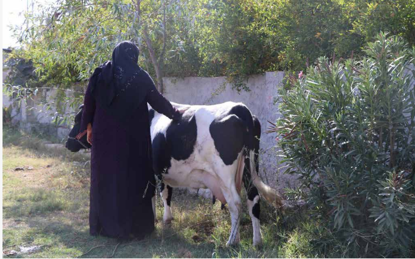
Bence hayvanların sevgiye ihtiyaçları var.