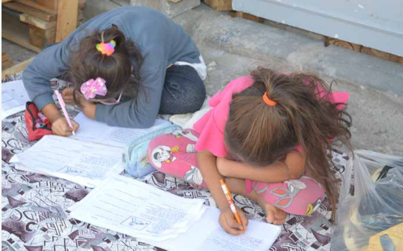
Ders çalışmanın yeri ve zamanı yoktur.