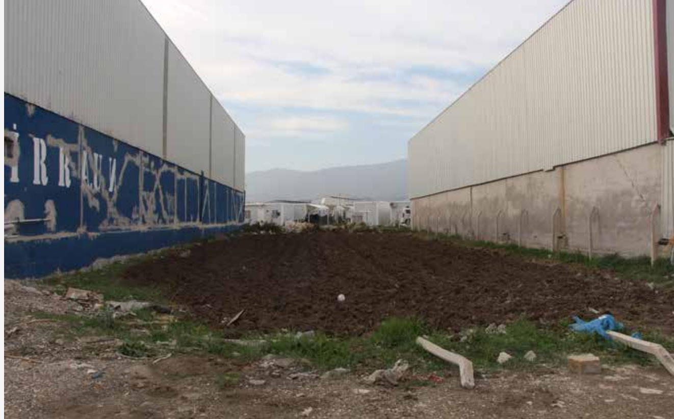
Bu fotoğraf bana karamsar bir his veriyor, yalnız hissettiriyor.