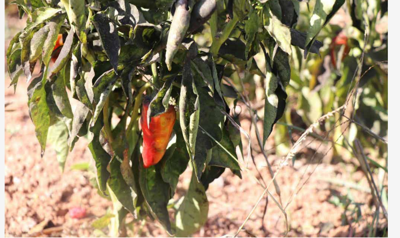
Biber o kadar güzel ki acı olsa da ağzımıza tatlı gelir.