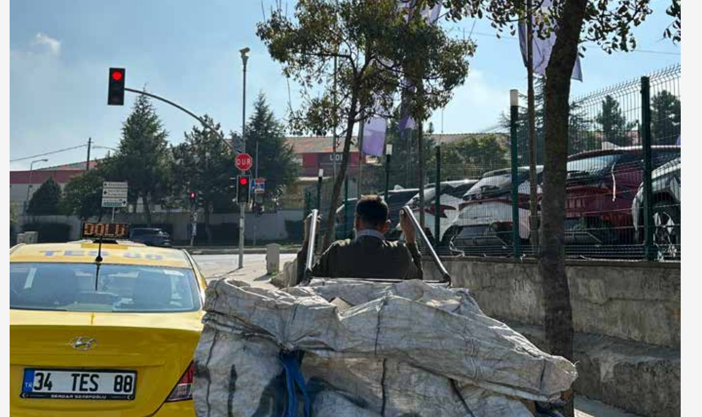
Defne, 15 yaşında İstanbul

Okul yolunda, mahallede sıkça gördüğüm, kendi hayatını ve sağlığını tehlikeye atarak ekmek parasını kazanmaya çalışan çöp toplayıcıları. Kendi imkânlarıma şükrederken, bu zor şartlardaki insanlar için üzülüyorum.