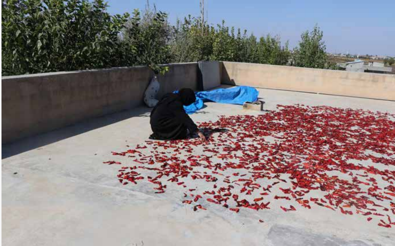
Ne kadar acı olsa da sonu hep tatlı, isotun tadı hep farklı.