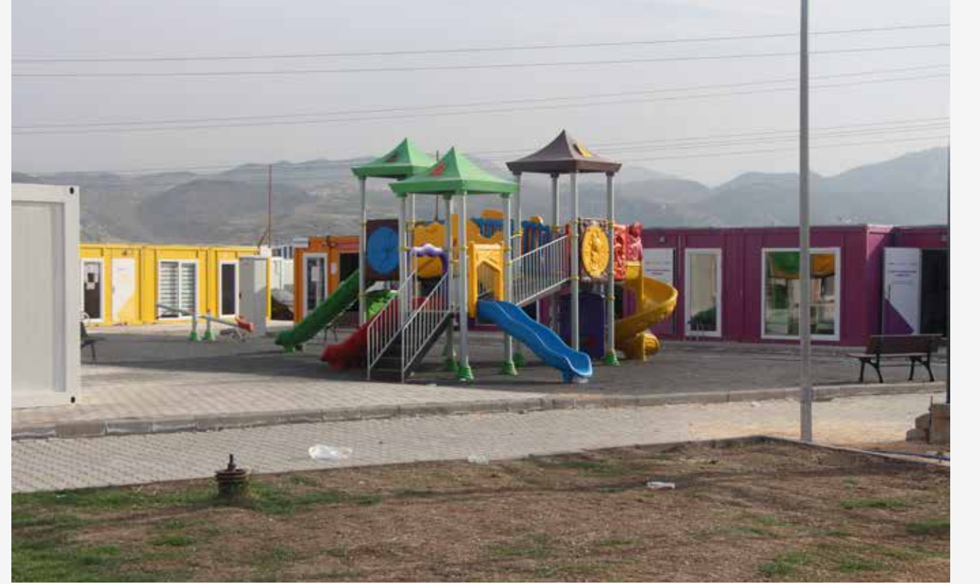
Konteyner kentte çocukların eğlence alanı.