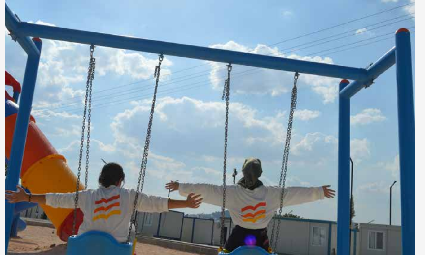
Salıncakta sallanmak sadece küçükler için değildir.