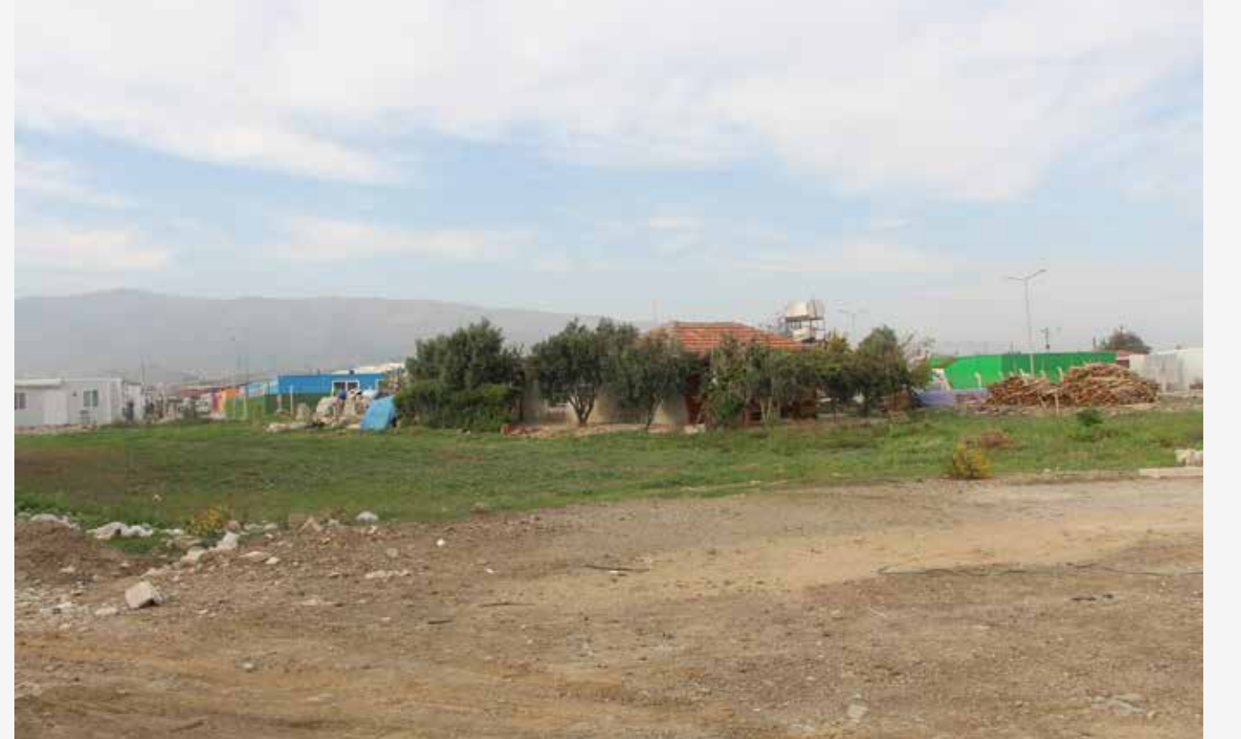
Yeşillik, doğallık iyi hissettiriyor.