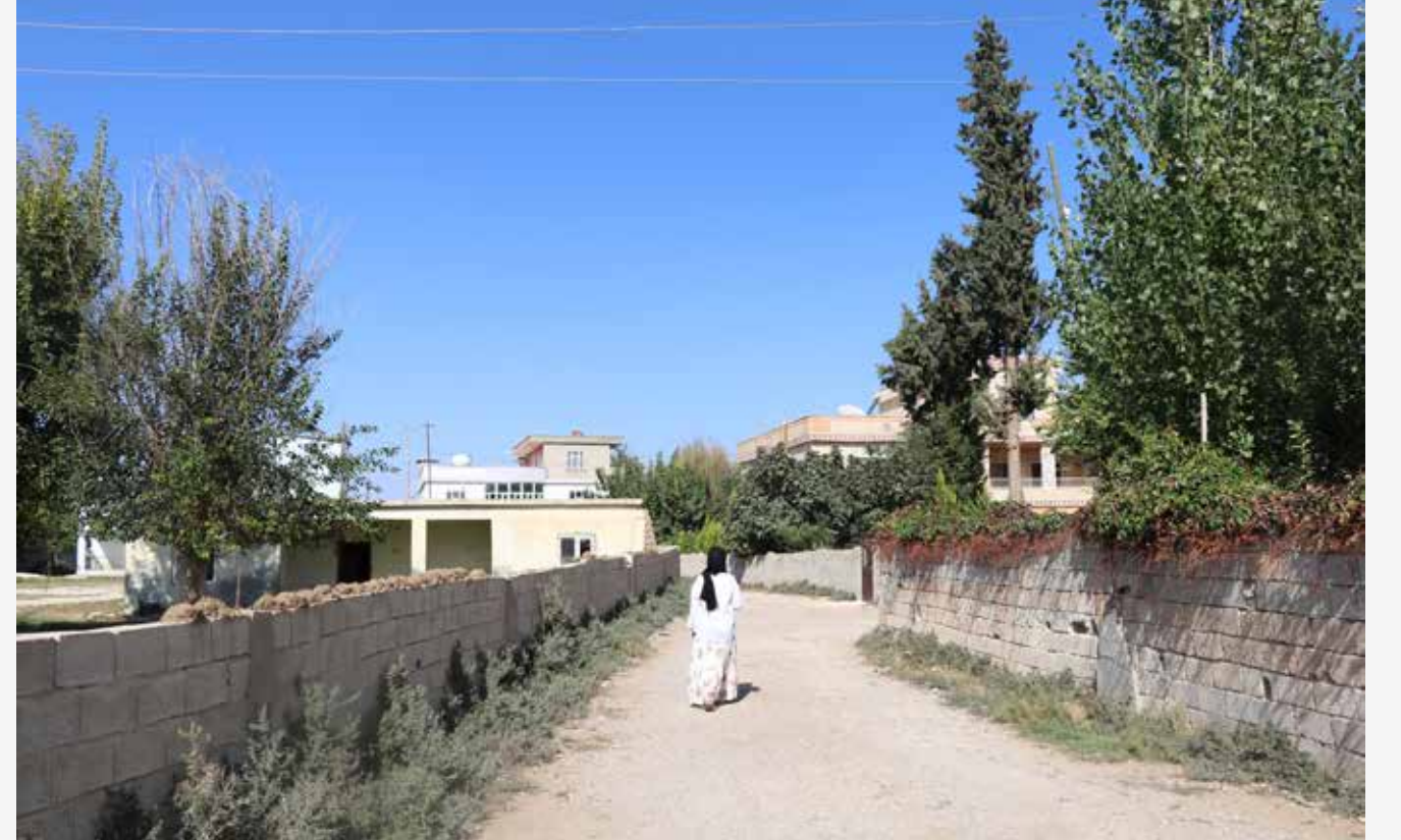
Sanırım hayattaki en güzel şey yürümek.