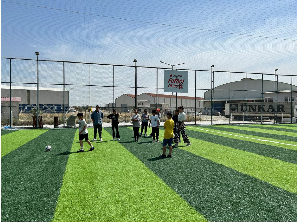
Futbol sahasından bir görünüm (Hatay-Antakya)

Hareket içeren eylemleri, her iki kentte de kızlar ve oğlanların birlikte yapmasını -tarama sonuçlarının gösterdiği gibi, oğlanların hem bisikletle hem de toplu oyunlarla daha çok vakit geçirdiğini anlamış olsak da- alanların ortak kullanımı ve kız çocukların fiziksel aktivitelere erişimi açısından önemli bir not olarak düşünmeliyiz. Görüşme yaptığımız kız çocuklardan bazıları spor aktivitelerine özel bir ilgi duyduklarını belirttiler. Kız çocukların yaşamında eğitim ve sosyal hizmetlerle birlikte spora erişim ve yeteneklerinin de desteklenmesi gelişim açısından büyük önem taşıyor.