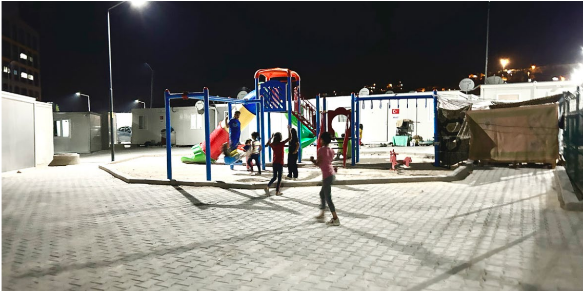
Kahramanmaraş-Pazarcık Hastane Konteyner Kenti'nde gece park kullanımı

Her iki konteyner alanında da çocukların kullanabilecekleri ortak alanlar, "sokak" ya da konteyner araları, kent içindeki oyun parkı alanları ve spor alanlarından oluşuyor. Sıcak, burada da günlük akışı önemli ölçüde etkileyen bir faktör. Sahada olduğumuz haziran başında bile çocuklar konteyner içlerinin sıcaklığından şikayet ediyordu. O nedenle kentlerde gölgelik -hatta tercihen ağaçlık- alan olmasını istiyorlar. Spor alanları hep güneş altı olduğu için gündüz saatlerinde bu alanların kullanımı limitli. Aynı nedenle akşam saatleri dışında da bu alanlarda zaman geçirme istekleri oldukça yoğun. Antakya'da spor alanları gece 12'ye kadar aydınlatılıyor. Pazarcık'ta ise çocuklar daha çok konteyner önlerinde vakit geçiriyorlar. Yine sığağa bağılı olarak gece geç yatıp gün içinde geç kalkmak ya da gün içinde uyuyup akşam dışarı çıkmak eğilimi oldukça yaygın.