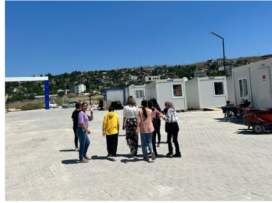
Haritalama ve yürüyüş atölye çalışmaları

Odak gruplara ve atölyelere katılacak çocuklara, çalışmaları yürütecek uzmanlar tarafından Merkez Sorumlularına iletilen yazılı bilgilendirme aracılığıyla merkeze kayıtlı çocukların gö-