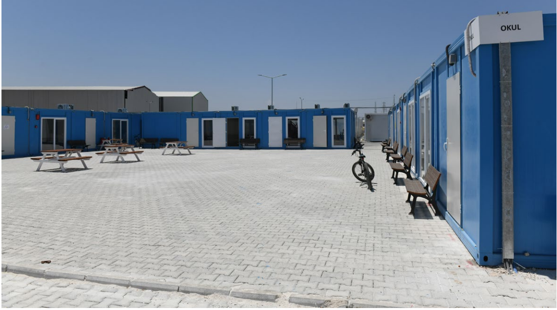
Hatay-Antakya'daki konteyner kentte yeni kurulan eğitim adası

Çalışma yaptığımız konteyner kentlere ilk saha ziyaretimizde geçici barınma alanlarının genel durumuna ilişkin gözlemediğimiz ikincil afetlere açıklık, aydınlatma, altyapı ve hijyen problemleri gibi düzensizlikler büyük ölçüde çözülmüş olsa da yaşam koşulları zorlayıcı olmaya devam ediyor. Konteyner kentlerin yerleşim düzeni çoğunlukla birbirinden kopuk. Şehir ve ilçe merkezlerine ulaşım ise farklılık gösteriyor. Bu nedenle çocukların gündelik yaşamı çoğunlukla yaşadıkları konteyner kentle, erişebildikleri hizmetler de buldukları yerleşkede verilen hizmetlerle sınırlı kalıyor. Depremden etkilenen çocukların ve ailelerinin kalıcı konutlar tamamlanana kadar konteyner kentlerde yaşayacağı göz önünde bulundurulduğunda hem barınma koşullarının iyileştirilmesi hem de çocuk hizmetlerine ilişkin donanımların artırılması büyük önem taşıyor. 5