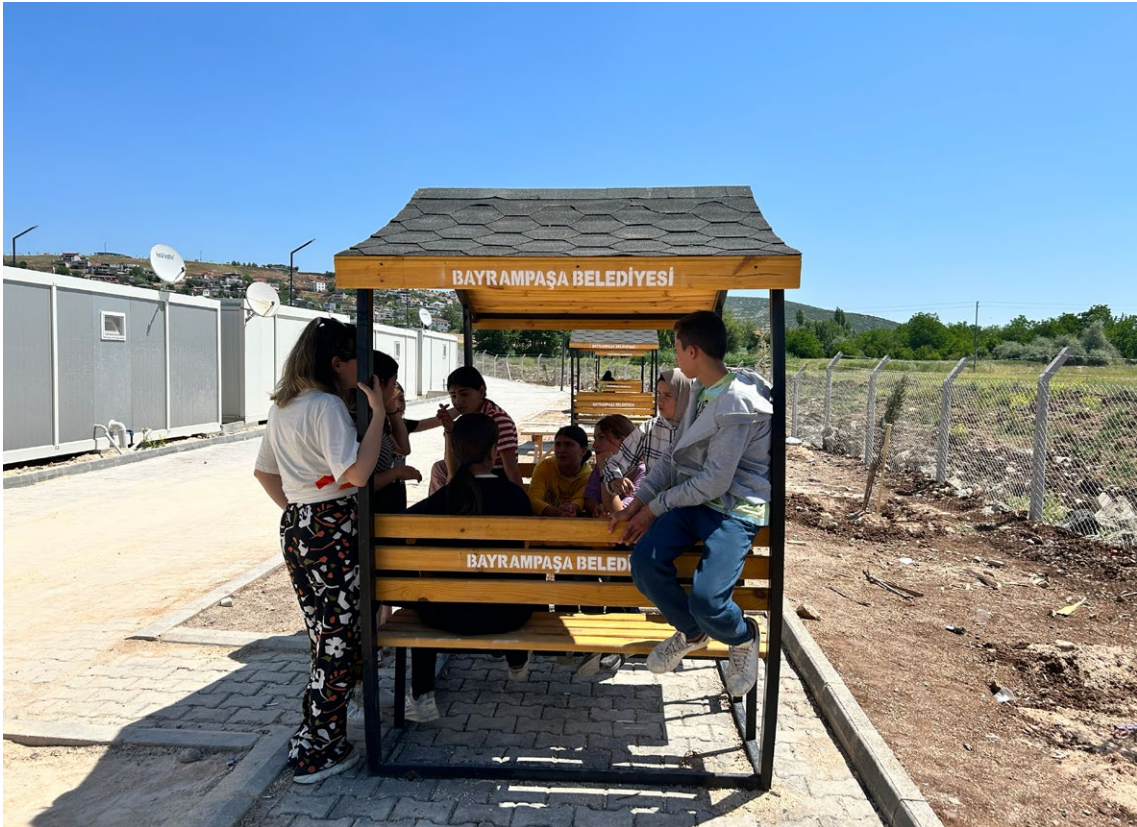
Çardak alanı (Kahramanmaraş-Pazarcık)

Parklar konteyner kentlerde çocuklar için ayrılmış alanların başında geliyor. Her iki konteyner kentte de birden fazla oyun parkı var. Ancak bu oyun parkları, farklı yaş gruplarının ihtiyaçları göz önünde bulundurulmadan, plastik malzemelerden yapılmış, güneşe açık alanlar. İki konteyner kentte de çalışma yürüttüğümüz atölyede, "Parklarda vakit geçiriyor musunuz?" sorusuna çocukların çoğu "Parkta bize göre bir şey yok ki" cevabını verdi. Zaman zaman daha az kullanılan, "sakin, kimsenin olmadığı" parklarda oturup arkadaşlarıyla sohbet edebildiklerini dile getirdiler. Pazarcık'ta çocuklar park alanlarının düzenlenmesine yönelik öneriler geliştirdiler. Kendilerine uygun daha büyük kaydıraklar, trambolin, tırmanabilecekleri oyuncaklar, daha fazla kişinin birlikte sallanabileceği, sallanırken sohbet edilebilecek büyük salıncaklar ve çardak önerilen başlıca oyun elemanları oldu.