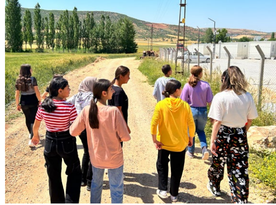
Çocukların gittiğı dere kenarından görünüm (Kahramanmaraş-Pazarcık)

Konteyner kentlerde alan yönetimine dair standardizasyon eksikliği, alan içinde araç dolaşımında da karşımıza çıktı. Antakya'da konteyner kent içinde araç dolaşımı sınırlandırılmışken Pazarcık'ta araç dolaşımı serbestti. Yine Antakya'da bir otopark alanı bulunurken, Pazarcık'ta araçlar konteyner önlerine ya da açık alanlara park ediliyorlardı. Ayrıca araçlarını kent içi için çok hızlı kullananlar da var. Bu durum vakitlerinin büyük bölümünü açık alanlarda ve sokakta geçiren çocuklar için hem risk oluşturuyor hem de alan kullanımını kısıtlıyor. Nitekim hem